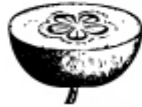
Fruit à papiris (Pomme)

Dernière prise de Commande 13H45 et 21H00